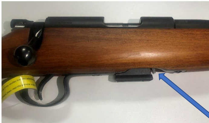
Verrouillage avec la palette

Garnir le chargeur. (Maxi 5 cartouches en 22 LR). Introduire et verrouiller le chargeur dans la carabine.